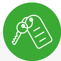
check-in off limits h24

Oggi fai 10 viaggi? Domani risolvi tutto dal tuo ufficio e se dovesse sopraggiungere un guasto tecnico all'impianto, basta un click.