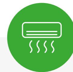
qualità dei servizi accessori