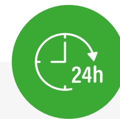
assistenza tecnica specializzata e manutenzione full time