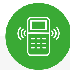
comunicazione diretta con gli ospiti