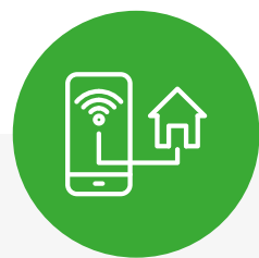
gestione impianti da smartphone e tablet