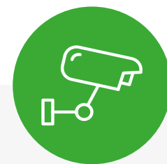
controllo e sicurezza